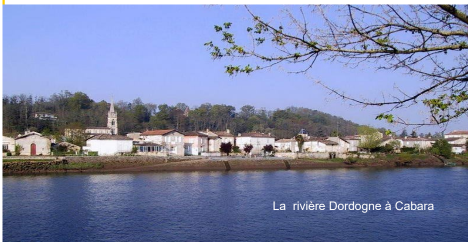
La rivière Dordogne à Cabara